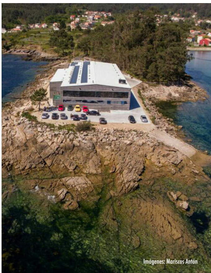
Imágenes: Mariscos Antón